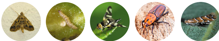
תצפית מלכודות ניטור עש תפוח - נוה אטיב 2014 (חנוך סייף)