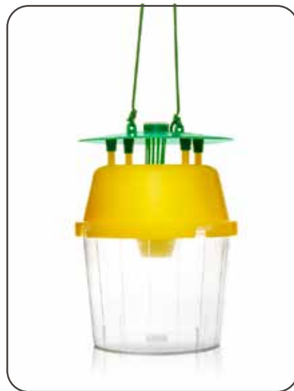
מלכודת IPS (יוניטראפ)