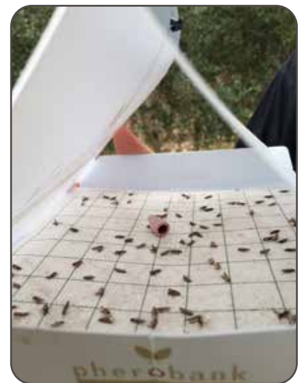
לוחית הדבק והפרומון