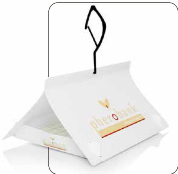
מלכודת דלתא ביו-יום

המלכודת עשויה פלסטיק עמיד (פוליפרופילן) ומיועדת לעמוד בתנאי מזג האוויר השונים (כולל גשם) והריסוסים בפרדס. המלכודת מורכבת מגוף המלכודת בצורת משולש ומגיעה ביחד עם לוחית דבק אנטמולוגי המיועדת להנחה בתחתית המשולש. הנדיפית בצורת חרוט אדום מכילה את הפרומון הנקבי המושך את זכרי העש אל המלכודת. יש להניח את הפרומון במרכז לוחית הדבק.